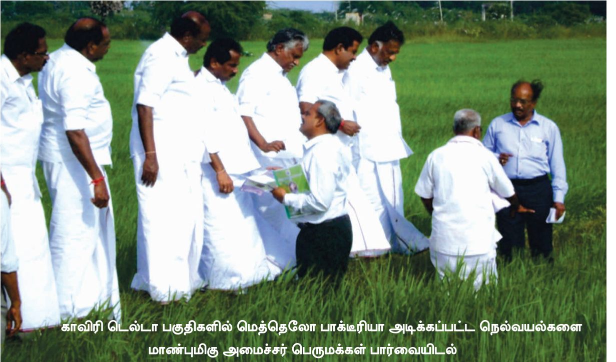
காவிரி டெல்டா பகுதிகளில் மெத்தெலோ பாக்டீரியா அடிக்கப்பட்ட நெல்வயல்களை மாண்புமிகு அமைச்சர் பெருமக்கள் பார்வையிடல்

மரப்பயிர்களான தென்னை, மா, கொய்யா, பப்பாளி முருங்கை, மாதுளை போன்ற பயிர்களுக்கு சொட்டுநீர் பாசன மூலமாக வேர்களுக்கு சென்று அடையுமாறு கொடுக்கலாம் அல்லது கைத்தெளிப்பான் அல்லது விசைதெளிப்பானைக் கொண்டு கைக்கு எட்டும் உயரம் வரை இலைகள் நன்கு நனையும்படி தெளிக்கலாம்.